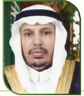
أ.د. عبدالرحمن بن عبيد اليوبي سعادة مدير الجامعة المكلف

في ضوء الإعداد الحديث للكوادر، والدور الذي تضطلع به الجامعات، والمرحلة التاريخية التي يمر بها الإنسان في عصرنا في ظل المتغيرات الهائلة في مجال الهندسة البشرية، بادرت جامعة الملك عبد العزيز إلى إنشاء « وحدة الإرشاد الأكاديمي » كركيزة مهمة في تطوير العملية التعليمية وتأسيس قواعد المشاركة والتفاعل والمساهمة في اتخاذ القرارات لبناء الشخصية القادرة علي مواجهة المستقبل بما يحمله من متغيرات.